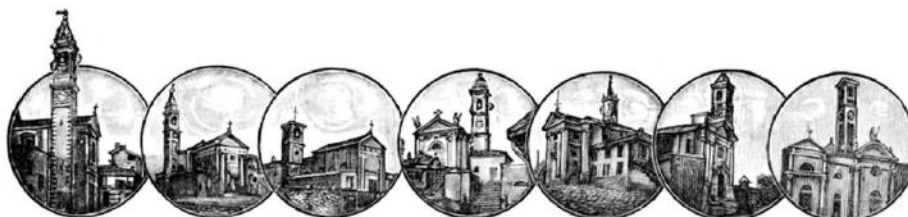
CAVARIA - S. STEFANO - OGGIONA - ORAGO - JERAGO - PREMEZZO - CAJELLO

CORSA PODISTICA COMPETITIVA VALEVOLE PER IL PIEDE D'ORO RISERVATA AGLI ISCRITTI P.S.V. E CORSA PODISTICA NON COMPETITIVA LIBERA A TUTTI